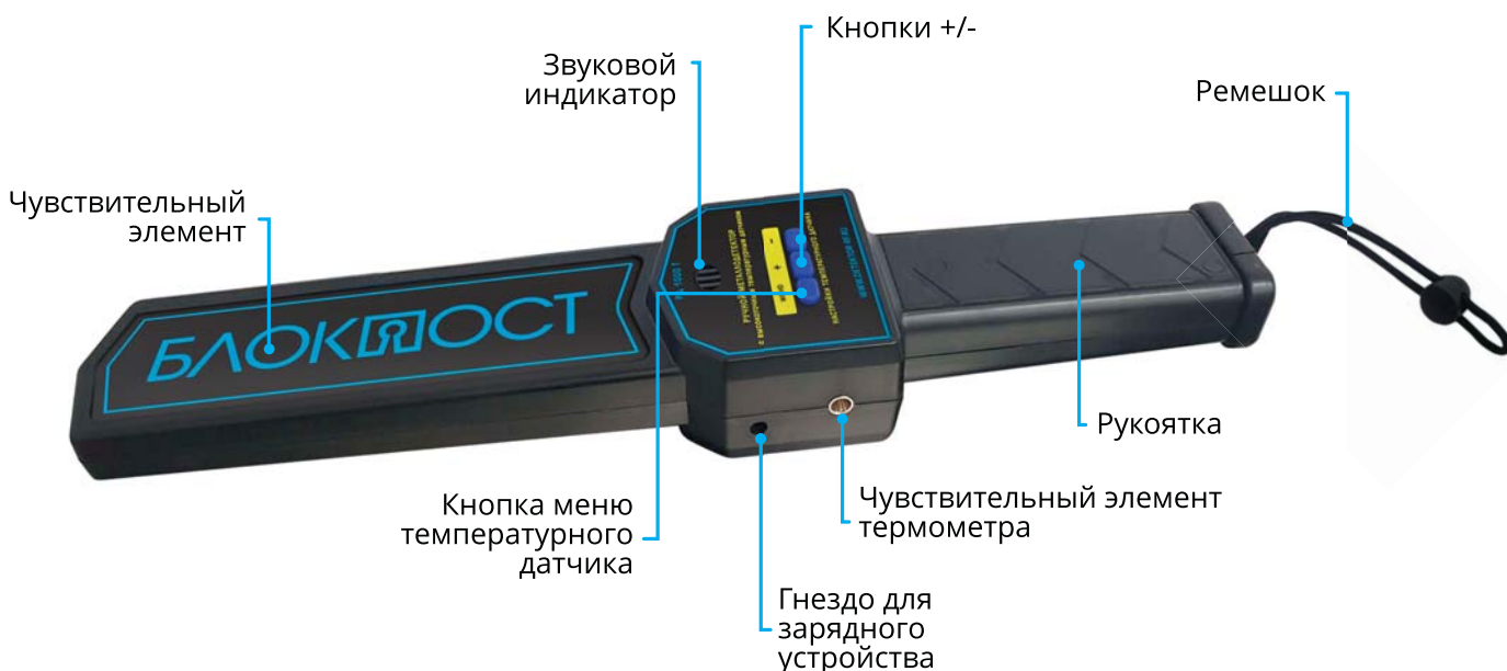
Рисунок 2 – Внешнее описание устройства-2