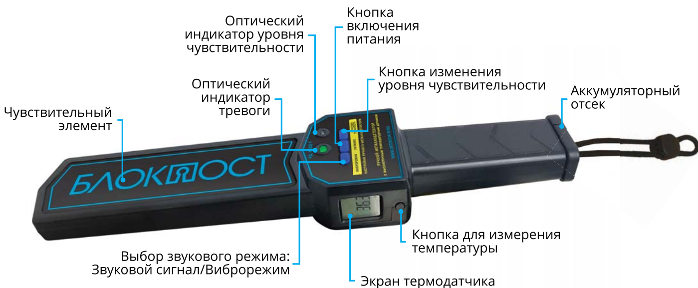
Рисунок 1 – Внешнее описание устройства

Ручной металлодетектор РД 1000 Т предназначен для обнаружения металлических предметов и измерения температуры. Характерные преимущества ручного металлодетектора марки БЛОКПОСТ – точность измерения температуры тела, небольшой размер и вес, высокая чувствительность по обнаружению черных и цветных металлов и функциональность изделия. Металлодетектор используется в местах с высокой проходимостью людей: аэропорты, вокзалы, таможенные службы, медицинские учреждения, государственные и социальные учреждения, заводы, учебные заведения, а также массовые мероприятия.